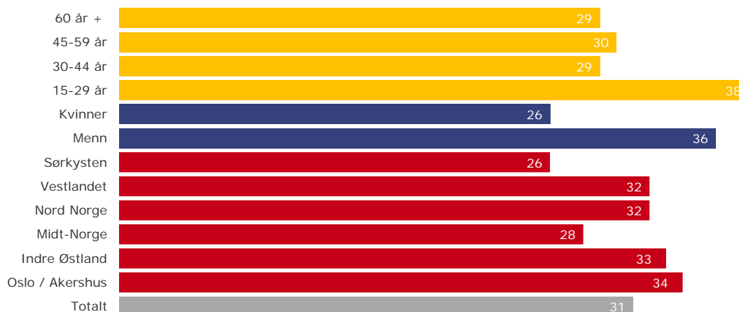
Tabell 5: Fordeling av radiolytting på digitale plattformer

Definisjon Oslo/Akershus Indre Østland: Hedmark, Oppland, Buskerud Sørkysten: Østfold, Vestfold, Telemark, Aust-agder, Vest-Agder Vestlandet: Rogaland, Hordaland, Sogn og Fjordane Midt-Norge: Sør-Trøndelag, Nord-Trøndelag, Møre og Romsdal, Nord-Norge: Finnmark, Troms, Nordland